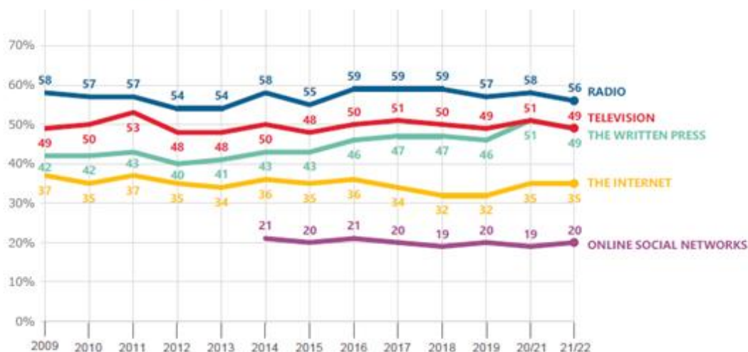
QA6a How much trust do you have in certain media? For each of the following media, do you tend to trust it or tend not to trust it? (% - EU - TEND TO TRUST)